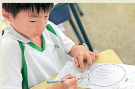
●學生在法語課堂發揮創意，為故事人物配上對話內容。