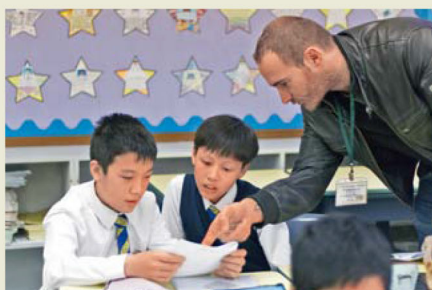
●法語導師向學生分享家鄉的文化特色，擴闊學生的眼界。