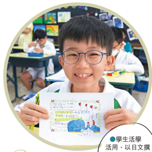
●學生活學活用，以日文撰寫心意卡向父母表達敬意。

香港學生自幼已學 習兩文三語，為了提升學生的 語文能力，認識其他國家的語言文 化，近年不少小學引入第四、甚至第五語 言，讓學生額外多學一種語言。法語、西班 牙語、日語一直是本港學生的熱門選擇，近 年韓風直捲全球，而韓語更被列入2025年中學 文憑試丙類其他語言科目之一。今期《親子王》 訪問了幾間開辦外語課程的小學，由各校校 長親自講解外語的教學模式及學生表現；校 長們更為家長提供學習外語錦囊，家長 可視乎子女興趣及能力，為他們選 擇合適的課程。