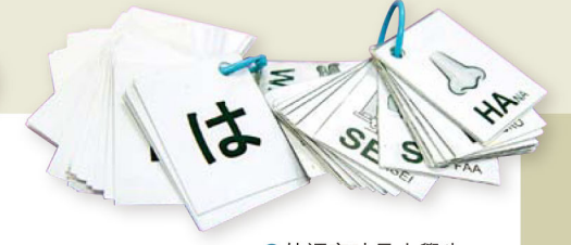
●外語字咭是小學生學習外語的好幫手。