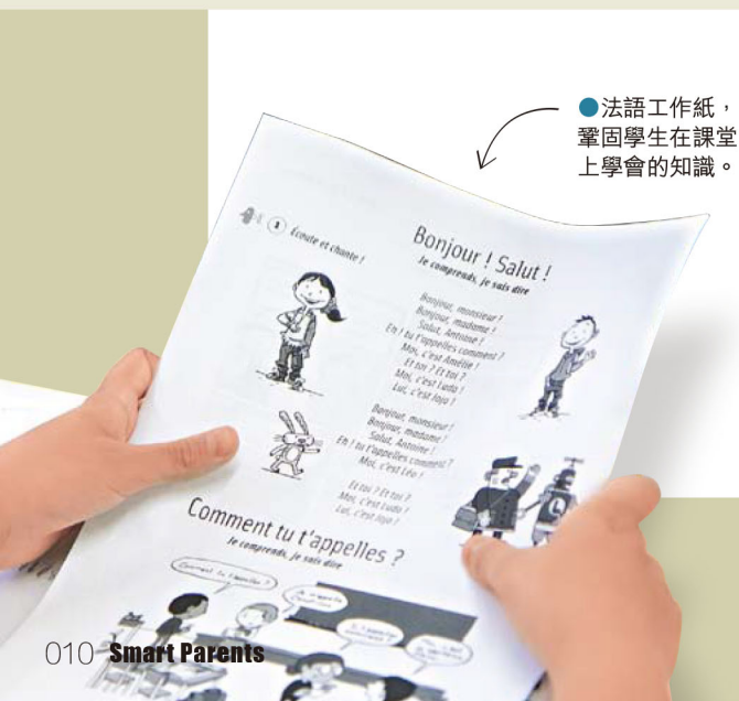
●法語工作紙，鞏固學生在課堂上學會的知識。