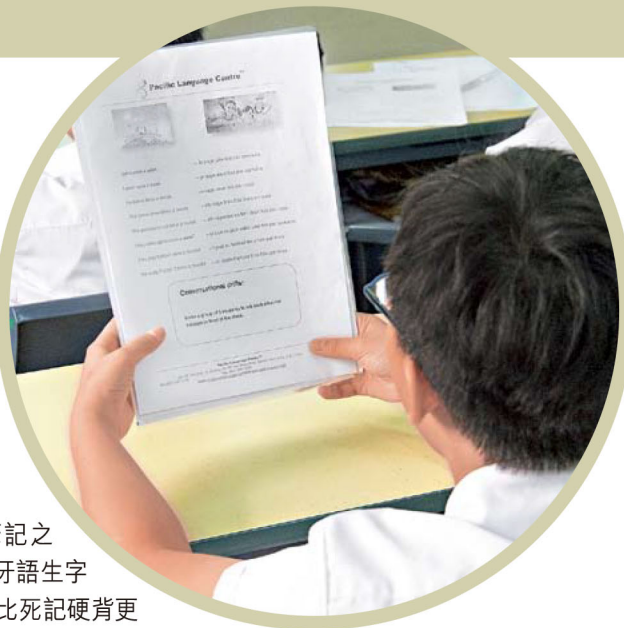
●法語課程鼓勵學生多以法語交流溝通。

鄭校長直言，小朋友學習外語後，對外地的多元文化會產生興趣，若在日常生活有機會接觸、運用外語，更會事半功倍，「例如去食日本餐，餐廳Menu的食物名稱，學生都睇得明。」學生有機會應用學懂的知識，會令他們得到滿足感，亦有動力繼續深造外語。