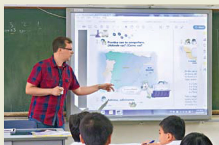
●西班牙語導師透過講解西班牙地圖，加深學生對當地的認識。